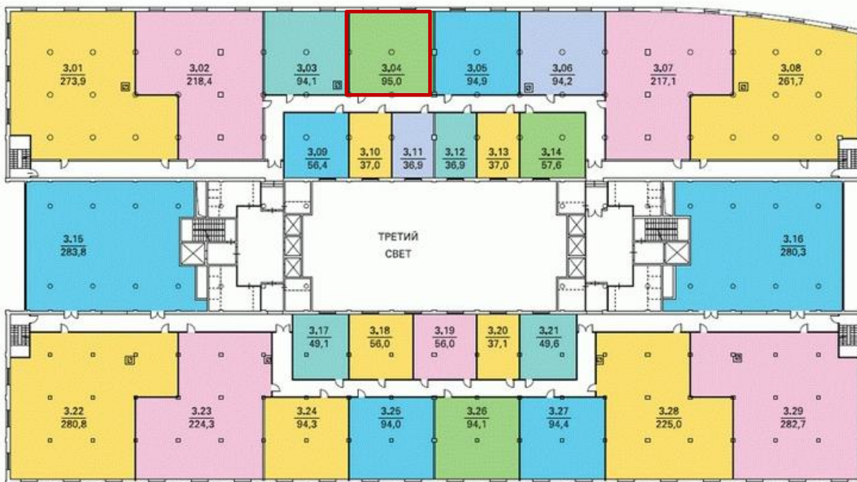
Блок 95 кв.м.